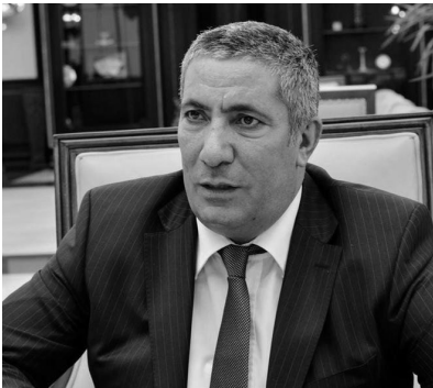
Yeni Azərbaycan Partiyası İcra katibinin müavini, Milli Məclisin İctimai Birliklər və Dini Qurumlar Komitəsinin sədri

İnkişafa xidmət edən islahatların reallaşdırılmasında Azərbaycan Prezidentinə ən böyük dəstək xalqdan və ölkəsinin taleyini Cənab İlham Əliyevə etibar etmiş vətəndaşlarımızdan gəlir. Bu gün Azərbaycan xalqı Cənab İlham Əliyevi intibahın, siyasi sabitliyin, əmin-amanlığın, sülhün qaranlıq hesab edir və ona tam güvənir. Çünki xalq həyatında, taleyində baş vermiş böyük dəyişikliklərin, Azərbaycanı parlaq sabahlara doğru aparan siyasi kursun alternativsizliyini yaxşı dərk edir və bu siyasəti birmənalı dəstəkləyir. Uğurlar olsun, Cənab Prezident!