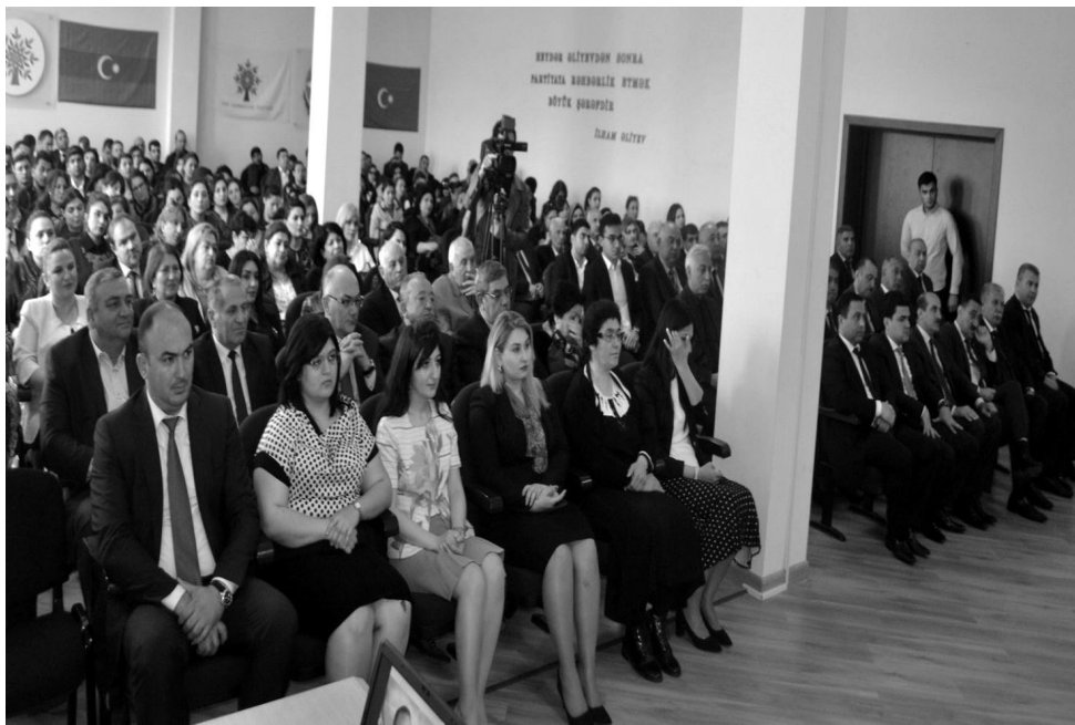
Sonra Ulu Öndər Heydər Əliyevin həyat və fəaliyyətindən bəhs edən film göstərilib.