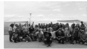
Azərbaycanın multikulturalizm modelini dünyada dinlər, xalqlar və millətlər arasında birgə yaşayışın harmoniyasını yaratmaq üçün bir nümunə kimi göstərilir və eyni zamanda, öyrənilir. Azərbaycanın dövlət siyasətinə çevrilən multikulturalizm siyasətinin əsası ulu öndər Heydər Əliyev tərəfindən qoyulub. Hazırda Prezident İlham Əliyev bu siyasəti uğurla davam etdirir.

Yazıda Azərbaycanın multikulturalizm modelindən bəhs edilir. Bakı Beynəlxalq Multikulturalizm Mərkəzinin Layihələr şöbəsinin müdiri Abbas İsmayilov sessiyada