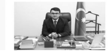
Müstəqil Azərbaycan Respublikasında millətlərarası münasibətlər və din sahəsində həyata keçirilən dövlət siyasəti beynəlxalq hüquq normalarına və zəngin tarixi köklərə əsaslanır və bu səbəbdən də dünya ictimaiyyətinin diqqətini cəlb edir.

ki çıxışına istinad olunaraq bildirilir ki, Azərbaycanın multikulturalizm modelinin məqsədi dünyada dinlər, xalqlar və millətlər arasında birgə yaşayışın harmoniyasını yaratmaqdır. Hazırda bu model dünyaya bir nümunə kimi göstərilir və eyni zamanda, öyrənilir. Azərbaycanın dövlət siyasətinə çevrilən multikulturalizm siyasətinin əsası ulu öndər Heydər Əliyev tərəfindən qoyulub. Hazırda Prezident İlham Əliyev bu siyasəti uğurla davam etdirir.