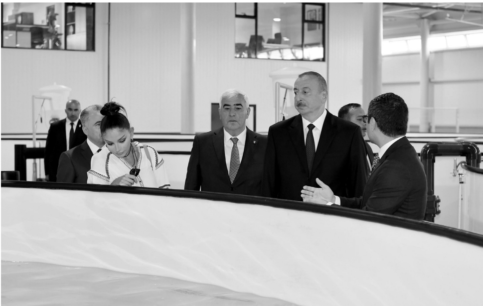
Əvvəli Səh. 2

Sakin: Cənab Prezident, biz Pirallahı rayonunun ağsaqqalları Sizə, Mehriban xanıma bir daha xoş gəlmisiniz deyirik. Bu gün Pirallahı qəsəbəsi, Pirallahı rayonu demək olar ki, Bakı şəhərinin ən qabaqcıl rayonlarından biridir. Görülmüş bütün bu işlərə görə Sizə dərin minnətdarlığımızı bildiririk. Bütün bu abadlıq işləri Sizin sayə-