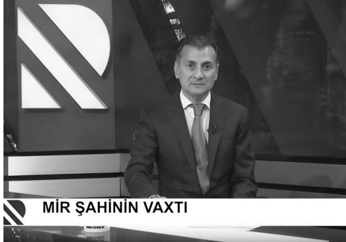
MİR ŞAHİNİN VAXTI

duğu məqsədə çatmaq üçün lazım olan bütün dələduzluq infrastrukturunu əllərinin altındadır. Necə deyərək, məhdud bir məkanda, lap elə Vahid pəncərə yaradıblar. İstənilən sənədi hazırlamaq üçün istənilən dövlət qurumunun ixtiyarını imitasiya edə biləcək mexanizmə, alətlərə, avadanlıqlara malikdirlər. Təsəvvür edin: onlara kimisə siyasi mühacir kimi xaricə göndərmək lazımdır. Bəs xaricdə Siyasi mühacir kimi tanınmaq üçün nə tələb olunur? Tutaq ki, təzyiq məruz qaldığını sübut edən arayıf. Buyurun. Belə bir sənədi tərtib etmək üçün lazım olan hər növ imkan, zəruri blank forması, müvafiq möhür və ya ştamp var. Qalır imza qoymaq. O məsələ də öz həllini belə tapır: