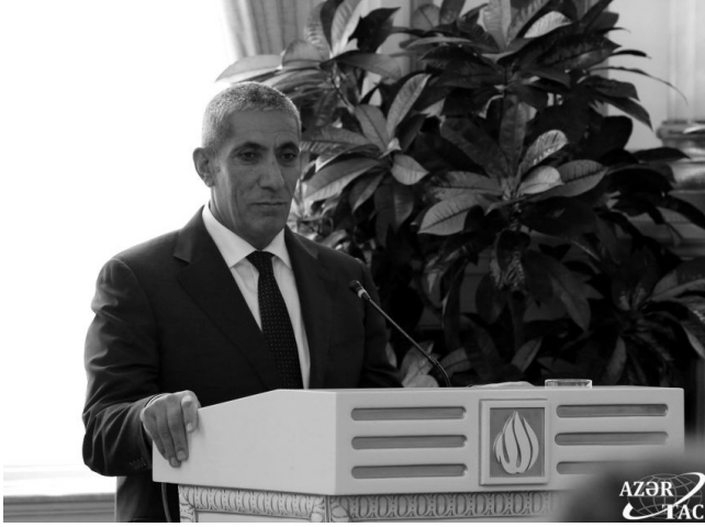
Əvvəl Səh. 6