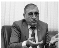
Millət vəkili Tahir Rzayev: "Rusiya Ermənistan qarşı təsir vasitələrini işə salır"

Ermənistan keçirilən Avrasiya İttifaqının iclasında Rusiya prezidenti Vladimir Putin Paşinyana və onun komandasına tam açıq bir hörmətsizlik və sayğısızlıq nümayiş etdirdi. Bu, Rusiyanın Paşinyanı bir dövlət rəhbəri kimi qəbul etməməsi və ümumiyyətlə, Ermənistanın özünün quberniyalarından biri kimi baxması ilə səciyyələndirmək olar. Söhbət etdiyimiz müsahiblərimiz də qeyd etdik ki, Paşinyanın ağılsız siyasəti Ermənistanla-keçmiş "dostlar" ilə münasibətlərinin kəskinləşməsinə və münasibətlərin pozulmasına gətirib çıxarıb.