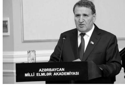
İsa HƏBİBBƏYLİ, AMEA-nın vitse-prezidenti, Milli Məclisin deputatı

Eyni zamanda, dövlətimizin başçısı Bakıda keçirilən Türkdillli Dövlətlərin Əməkdaşlıq Şurasının VII Zirvə Görüşündə vaxtilə Zəngəzur bölgəsinin Azərbaycandan alınub, Ermənistanla birləşdirilməsinə də diqqət çəkib. Regionun bugünkü reallıqlarını müzakirə etmək üçün Türkdillli Dövlətlərin rəhbərlərinin bir araya gəldiyi mötəbər beynəlxalq tədbirin tribunasından bu fikirlərin səsəndirilməsi Azərbaycanın prinsipial mövqeyindən bir addım da geri çəkilməyəcəyinə, öz ərazi bütövlüyünü bərpa etmək əzminə və gücündə olduğuna daha bir mesaj oldu. Bu, eyni zamanda, işğalçı Ermənistanın yürütdüyü təcavüzkar siyasətinin növbəti ifşası idi. Bu baxımdan, onu da xatırlatmaq olar ki, MDB Dövlət Başçıları Şurasının Aşqabadda keçirilən zirvə görüşündə ölkəmizin rəhbəri Ermənistanə çox ciddi diplomatik həmlə etdi - hücum diplomatiyasını ən yüksək səviyyədə və bütün məntiqi ilə ortaya qoymuş oldu. Ona görə də, qeyd edə bilərik ki, bu addımlar Ermənistan-Azərbaycan, Dağlıq Qarabağ münasibəti ilə bağlı mövqeyimizi kifayət qədər gücləndirdi. Prezident İlham Əliyev Ermənistanla faşizmin əbədləşdirilməsi ilə bağlı yürütdüyü siyasəti bütün dünyaya göstərdi.