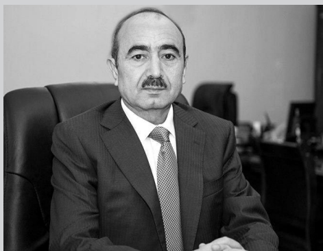
Əli Həsənov Azərbaycan Respublikası Prezidentinin ictimai-siyasi məsələlər üzrə köməkçisi, tarix elmləri doktoru, professor

O ktabrın 18-də Azərbaycanın dövlət müstəqilliyini elan etməsinin 28-ci ili tamam olur. 1991-ci il avqustun 30-da Ali Sovetin növbədənənar sessiyasında gərgin müzakirələrdən sonra "Azərbaycan Respublikasının dövlət müstəqilliyini bərpa etmək haqqında" Bəyannamə qəbul edildi. Bununla yanaşı, parlamentdə qəbul olunmuş qərarda Azərbaycanın dövlət müstəqilliyinin konstitusion əsaslarını yaratmaq üçün Konstitusiyaya Aktının hazırlanması nəzərdə tutuldu. 1991-ci il oktyabrın 8-də Azərbaycan Ali Sovetinin işə başlayan növbədənənar sessiyası bir neçə günlük müzakirələrdən sonra, oktyabrın 18-də Dövlət Müstəqilliyi haqqında Konstitusiyaya Aktını qəbul etdi. İstiqlaliyyətə gedən yola nəzər salaraq, bu dövrdə yaşamış proseslər haqqında aşağıdakı beş tezisi hörmətli oxucularımın diqqətinə çatdırmaq istəyirəm.