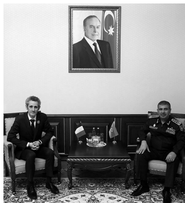
Fransanın bəzi şəhərləri ilə Azərbaycanın işğal olunmuş ərazi-

də əməkdaşlığın inkişaf perspektivlərinə dair fikir mübadiləsi aparılıb. Qoşunların təmas xəttindəki hazırkı vəziyyət barədə diplomata məlumat verən Müdafiə naziri vurğulayıb ki, Dağlıq Qarabağ münasibətinin nizamlanması ilə bağlı Ermənistanın tutduğu qeyri-konstruktiv mövqe regional təhlükəsizliyə ciddi təhdiddir. Nazir xüsusi qeyd edib ki, məsələnin həlli yolu beynəlxalq hüququn norma və prinsipləri əsasında Ermənistanın BMT-nin Təhlükəsizlik Şurasının müvafiq qətnamələrinin tələblərini yerinə yetirməyə məcbur edilməsidir.