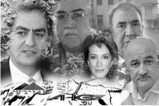
"Ölü" müxalifət növbəti ilə də satqınlıqla daxil olmaqdadır