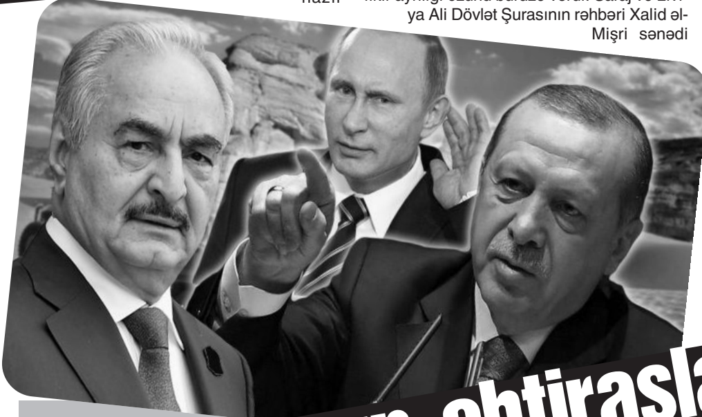
nazir fikir ayrılığı özünü büruzə verdi. Saraj və Liviya Ali Dövlət Şurasının rəhbəri Xəlifə el-Mişri sənədi

Ötən həftə İtaliya hökuməti, xüsusilə, baş