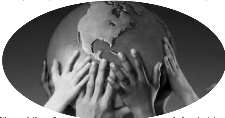
Əlbəttə, 2düz yol"u

Ən optimal hal bu uzlaşma məqamının tapılmasıdır. "Başqasına ziyan vurma!" devizi, "özünə qiymət!" devizi ilə tamamlanmalıdır. Ümumiyyətlə, başqaları haqqında düşünməyən, öz mənəvi durumunu ancaq etiqadla məhdudlaşdıran insanlar (askilər), başqa sözlə, öz həyatını digər insanlara münasibətdə deyil, ancaq Allaha münasibətdə qurmağa çalışan, ancaq öz daxili mənəvi rahatlığını təmin etmək istəyən insanlarla yanaşı, özü-