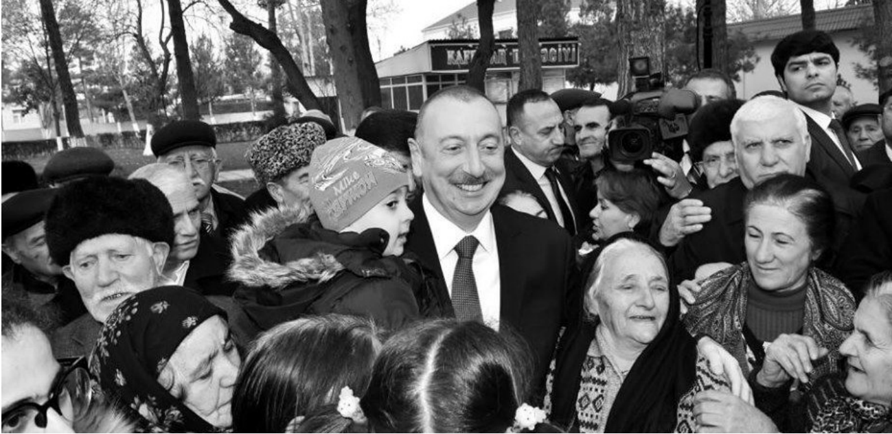
Əvvəli Səhə 12

Prezident İlham Əliyevin koronavirusla mübarizəyə strateji baxışı bir uğur hekayəsidir