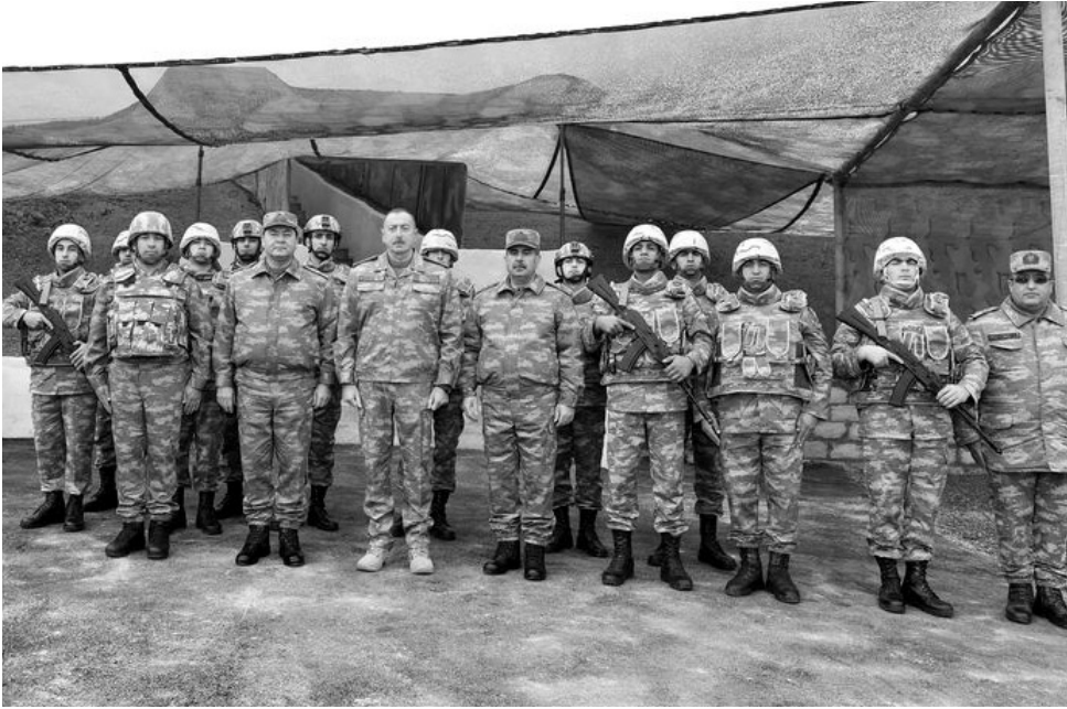
Azərbaycan Prezidenti, Silahlı Qüvvələrin Ali Baş Komandanı İlham Əliyev 2016-cı ildə erməni işğalından azad edilmiş ərazilərdə komanda məntəqəsinə baş çəkərək operativ şəraitlə tanış olarkən.

Münaqişə ilə əlaqədar onu da qeyd etməliyəm ki, bu yaxında erməni təbliğatına və bütövlükdə bu məsələ ilə əlaqədar Ermənistanın mövqeyinə növbəti böyük zərbə vurulub. Əslində, bu zərbəni onlar özləri özlərinə vurublar. Əlbəttə, bizim məqsədyönlü fəaliyyətimiz, beynəlxalq təşkilatlarla əlaqələrimiz bu zərbəni gücləndirib. Söhbət qondarma “Dağlıq Qarabağ respublikası”nda keçirilmiş qondarma “prezident seçkiləri” haqqındadır. Bu “seçkilər” bir daha göstərdi ki, heç kəs bu qanunsuz hərbi xunta rejimini tanımır. “Seçkilər”dən sonra aparıcı beynəlxalq təşkilatlar onları tanımadı, bu barədə açıq bəyanatlar səsləndi. ATƏT-in Minsk qrupunun həmsədrləri Rusiya, ABŞ və Fransa bəyanatla çıxış etdilər. ATƏT-in Parlament Assambleyası, Avropa İttifaqı, İslam Əməkdaşlıq Təşkilatı, Qoşulmama Hərəkatı