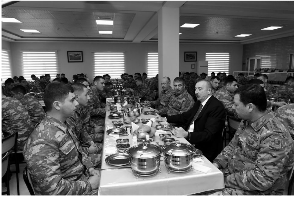
Azərbaycan Prezidenti, Silahlı Qüvvələrin Ali Baş Komandanı İlham Əliyev Beyləqan rayonundakı hərbi hissədə xidmət və məişət şəraiti ilə tanış olur.