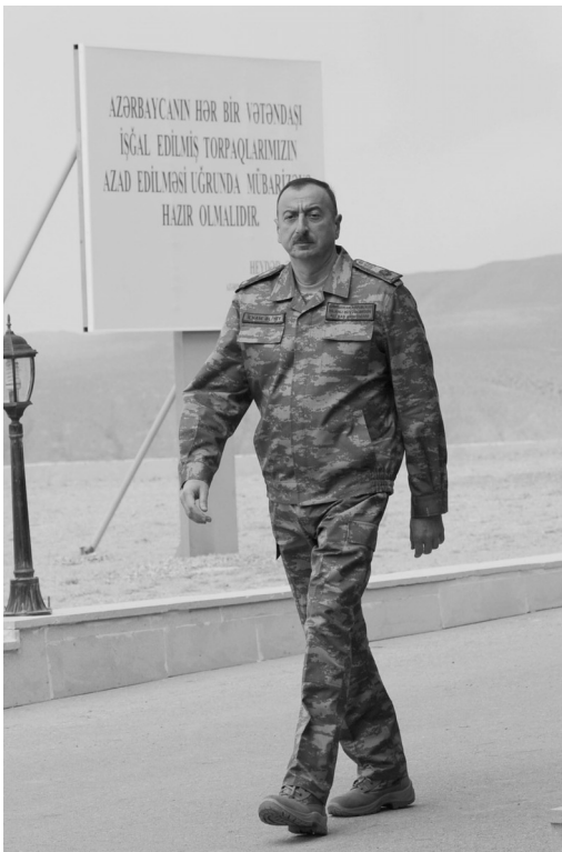
Azərbaycan Ordusunun möhkəmlənməsi, onun döyüş qüdrətinin və texniki təchizatının yüksəldilməsi Azərbaycan Prezidenti, Silahlı Qüvvələrin Ali Baş Komandanı İlham Əliyevin fəaliyyətində ən mühüm prioritetlərdən biridir.

Qırmızı Bayraqlı Taqanroq diviziyası Qafqazdan Berlinə qədər şanlı döyüş yolu keçib. Böyük Vətən müharibəsi cəbhələrində ləyaqətlə döyüşən, Azərbaycanın bayrağını