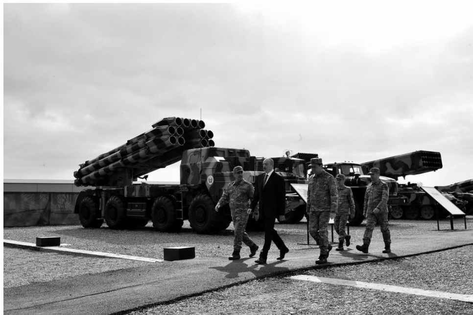
Rusiyadan Azərbaycana silah təchizatının həcmi 5 milyard dollar təşkil edir.

Sonradan, 1918-ci ildə Azərbaycan Xalq Cümhuriyyəti yaradılarda onun ilk fərmanlarından biri İrəvanın Azərbaycanın tərkibin-