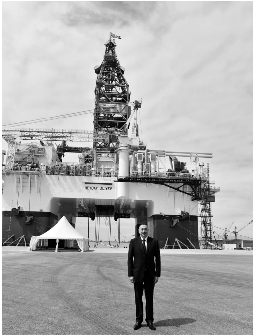
Heydər Əliyev adına yarımdalma qazma qurğusunun açılışında.

Bu gün strateji tərəfdaşlığa əsaslanan Azərbaycan-Rusiya ikitərəfli dostluq münasibətləri bütün istiqamətlər üzrə uğurla inkişaf edir