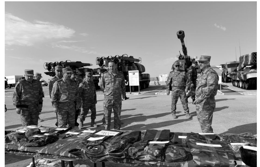
Prezident İlham Əliyev Azərbaycan Ordusunun silahlarının müasir nümunələri və hərbi qulluqçuların perspektivli təchizatı ilə tanış olur.

dən Ermənistanın tərkibinə verilməsi və Ermənistanın paytaxtı elan edilməsi haqqında fərman olub. Bu da tarixi faktır. 1921-ci ildə bolşeviklər partiyasının Qafqaz bürosu Dağlıq Qarabağın Azərbaycanın tərkibində saxlanması haqqında qərar qəbul edib. Bəzi erməni tarixçilərinin yazdığı kimi, Azərbaycana verilməsi haqqında yox, məhz saxlan-