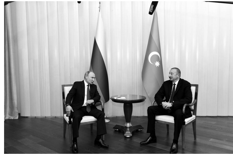
Rusiya ilə Azərbaycan arasında dinamik inkişaf edən əlaqələr çox cəhətdən prezidentlər Vladimir Putinin və İlham Əliyevin qarşılıqlı münasibətlərinin dostluq və etimad xarakteri ilə müəyyən edilir.

- Bu gün strateji tərəfdaşlığa əsaslanan Azərbaycan-Rusiya ikitərəfli dostluq münasibətləri bütün istiqamətlər üzrə uğurla inkişaf edir. Ölkələrimiz arasında çox fəal siyasəti dialoq mövcuddur. Prezident Vladimir