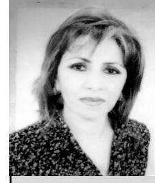
Ümidləri ölmüş müxaliflər

Strateqlərdən biri deyir ki, müharibələr axmaqlar başlayar, igidlər davam etdirər, ağıllılar bitirər. Müharibəni kimlər başlaması məlumdur. Biz isə qəhrəmanlıqla davam edirik.