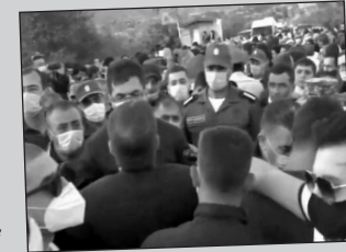
Yaxın gələcəkdə düşmən ölkədə ciddi çaxnaşmaların şahidi olacağıq"

Təbii ki, Paşinyanın ixtisarla bağlı bəyanatı, eyni zamanda, verdiyi vədləri yerinə yetirə bilməməsi, bir çox beynəlxalq tədbirlərdə savadsız, ziddiyyətli çıxışları ilə ölkəsini biabır etməsi, onunla diaspor arasında konfliktin yaranmasına səbəb oldu. Nəticədə Rusiyada yaşayan imkanlı ermənilər yarımlı tam dayandırdılar. Artıq ABŞ-da və Avropa ölkələrində fəaliyyət göstərən diasporlar, onu ölkəni idarə edə bilməməkdə, hakimiyyətə gələndən sonra vəziyyətin daha pisləşdiyini əsas gətirərək istefasını tələb edirlər. Bu barədə sosial şəbəkələrdə kifayət qədər məlumatlar var. Hesab edirəm ki, Paşinyanın siyasi gələcəyi çox qaranlıqdır və yaxın gələcəkdə düşmən ölkədə ciddi çaxnaşmaların şahidi olacağıq".