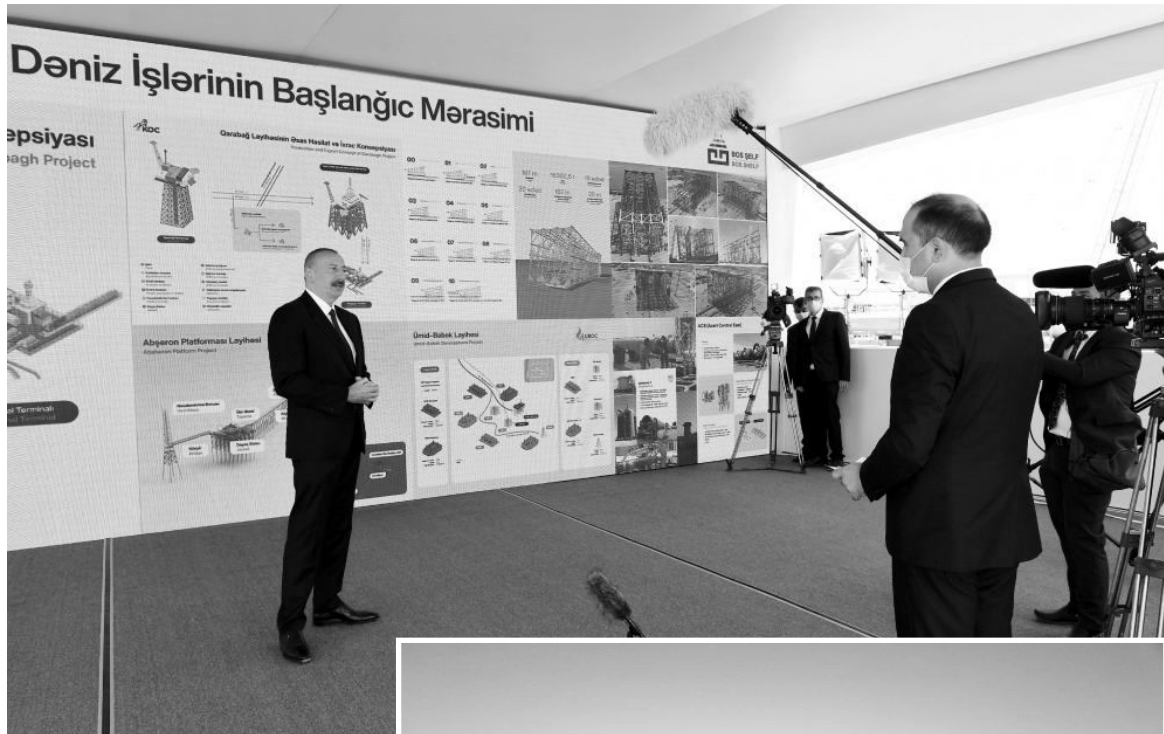
Əvvəli Səh. 2

“Əgər “Şahdəniz” üzrə kontrakt imzalanmasaydı, bu gün biz nəinki başqa ölkələrin, öz enerji təhlükəsizliyimizi təmin edə bilməzdik”