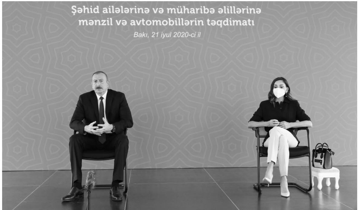
Şəhid ailələrinə və müharibə əlillərinə mənzil və avtomobillərin təqdimatı

qoşulur. Pandemiya qarşı mübarizədə Azərbaycanın əldə etdiyi uğurun başlıca səbəbi də milli birliyin