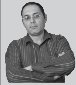
Xaricdəki müxalifət niyə susur?