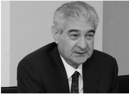
bizə yaxınlaşdırır. Çoxdan gözlə-

"Füzuli və Xocavənd rayonlarının azad edilən 8 kəndi böyük qələbəni əhəmiyyətli dərəcədə