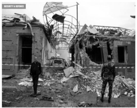
Is Armenia acting out a new Srebrenica in the South Caucasus?

POLITICS BUSINESS & ECONOMY SECURITY & DEFENCE ENERGY ENVIRONMENT HUMAN RIGHTS