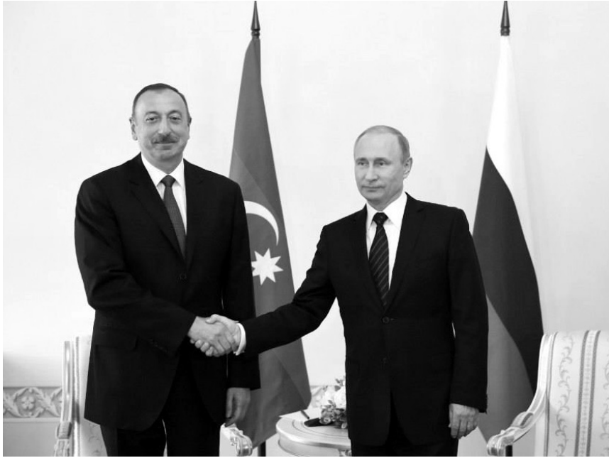
siyalarının açılması məsələləri müzakirə edilib. Regionda uzunmüddətli sülhün təmin ediləcəyinə əminlik bildirilib.

Dövlət başçıları, həmçinin azərbaycanlı və erməni əhaliyə humanitar yardım göstərilməsi məsələlərini müzakirə ediblər. Söhbətin gedişində 10 noyabr tarixli birgə Bəyanatın bəndlərinə müvafiq olaraq nəqliyyat infrastrukturunun inşası və nəqliyyat kommunika-