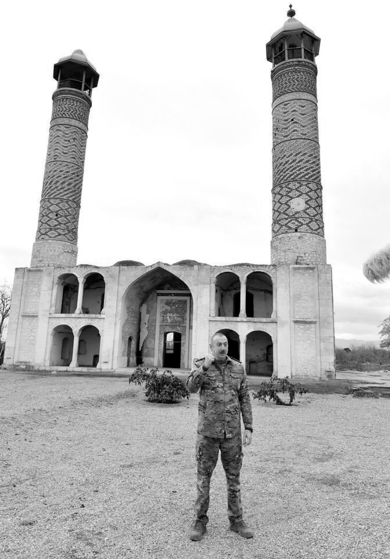
Əvvəl Səh. 2

Bu gün, müharibə başa çatandan sonra və hətta müharibə dövründə bütün dünya, bütün Azərbaycan xalqı gördü ki, bunun nə qədər böyük əhəmiyyəti var idi. Əgər biz münaqişənin həlli üçün lazımı hüquqi baza yaratmasaydıq, bu gün problemlərlə üzleşə bilərdik. Biz bütün beynəlxalq təşkilatlarda ədaləti, beynəlxalq hüququ tanıyan, əks etdirən qərar və qətnamələr qəbul etdirdik. BMT Təhlükəsizlik Şurasının 4 qətnaməsi 1993-cü ildə qəbul edilmişdir. Amma ondan sonra biz BMT Baş Assambleyasının qətnamələrini, İslam Əməkdaşlıq Təşkilatının qətnamələrini, Qoşulmama Hərəkatının, Avropa Parlamentinin, Avropa Şurası Parlament Assambleyasının qərar, qətnamələrini qəbul etdirdik.