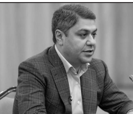
Paşinyanın istefası bizə ləyaqətimizi qorumağa şans vermək