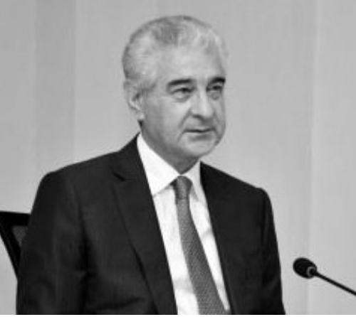
Əli Əhmədov Yeni Azərbaycan Partiyasının Sədr müavini - İcra katibi

Xalqın tarixi onun həyatının unudulmayan anlarının salnaməsidir. Bu anlar xalqın keçmişindən xəbər verir, taleyini müəyyən edir, gələcəyinə işıq salır. İndiki nəsillərin şahidi olduğu son 30 ilin millətimizin tale salnaməsinin parlaq hadisələrlə zəngin olan səhifəsi hesab ediləyəcək tam haqqı çatır. Azərbaycanın dövlət müstəqilliyinin bərpası, qısa vaxtda möhtəşəm iqtisadi yüksəliş yolu keçərək müasir və qüdrətli məmləkətə çevrilməsi tariximizin əbədiyyətə qovuşan səhifələrini təşkil edir. Bu tarix xalqımızın rəşadətini, dövlətimizin qüdrətini təzahür edir. Bu tarix 2020-ci ilin Vətən müharibəsində müşahidə etdiyimiz qəhrəmanlığın və şanlı zəfərin istinad nöqtəsi, ilham mənbəyidir.