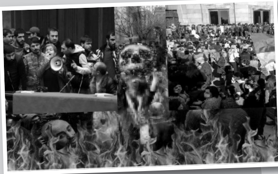
den bir qədər əvvəl ele o parlament kürsüsündən, "Qarabağı sahibinə, Azərbaycana qaytaraq" deyən? Bunu biliblə torpaqların özlərinə məxsus olması iddiası ilə çıxış edən birinci şəxsdir bu Nikol, yoxsa sonuncu? Hələ də erməni cəmiyyətini əllərindən geri alınan torpaq, özü də özlərinə məxsus olmayan, 30 ilə yaxın müddətdə viran qoyduqları özge, yad torpaqları yandırımı? Hələ də bu itgi barədə, Balasanyan kimi bir Xocalı qatilinin cürbəcür absurd ifadələri, fikirləri səslənir yoxsa? Bu fikirlərə niyə erməni cəmiyyəti münasibət bildirməmişdir? Niyə öz rəhbərlərini münasibət bildirməməkdə günahlandırılan özləri bu axmaq təxəyyüllərə, ağılsız, absurd iddialara münasibət bildirmir? Məgər bu yanlışlıqlar deyilməz?

N ikol Paşinyan və hökuməti, onsuz da böyük problemlərlə üzləşib. İndi ölkə vətəndaşlarının qarşılarında olan problemlər onun heç ağlının ucundan da keçmir. Ermənistan vətəndaşları qorxu, təlaş içəri-sindərsə də, bu heç bir şəkildə Paşinyanın komandasını da, özünü də maraqlandırmır. Əks halda, müəyyən tədbirlər görməkləri bir yana, susmağa davam etməzdilər, ən azından müəyyən izahlarla etirazçıların qarşısına çıxardılar.