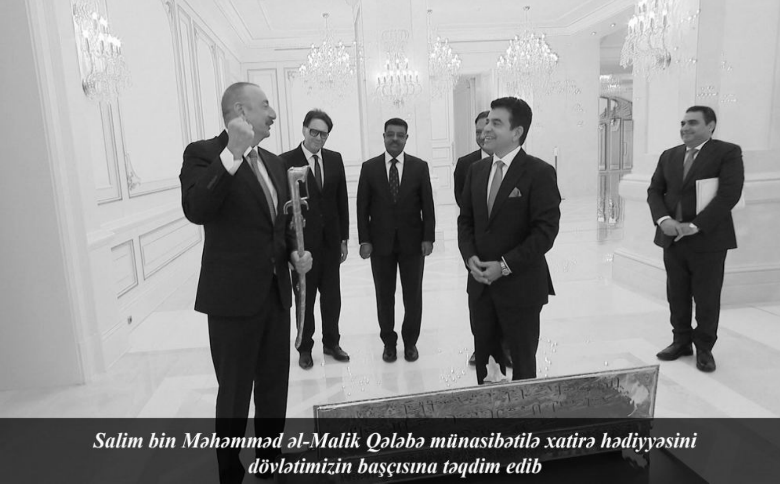
Salim bin Məhəmməd əl-Malik Qələbə münasibətilə xatirə hədiyyəsini dövlətimizin başçısına təqdim edib

Prezident İlham Əliyev ICESCO-nun Baş direktorunun rəhbərlik etdiyi nümayəndə heyətini qəbul edib