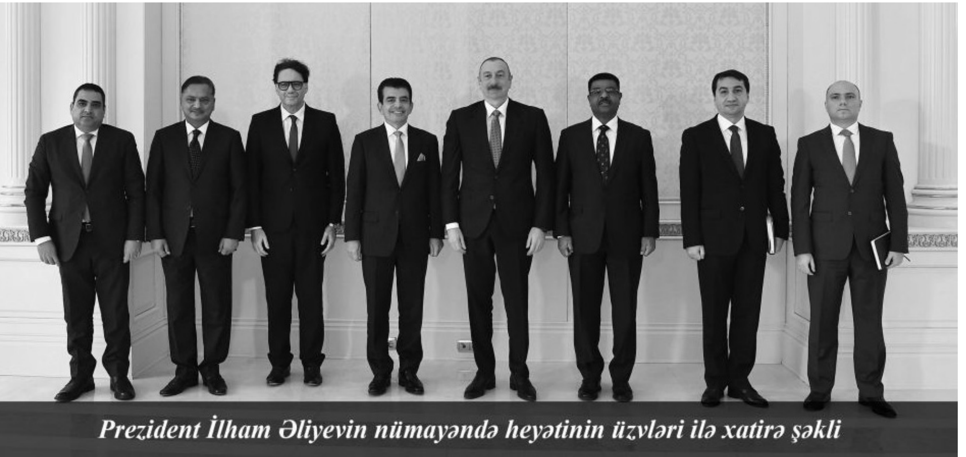
Prezident İlham Əliyevin nümayəndə heyətinin üzvləri ilə xatirə şəkli