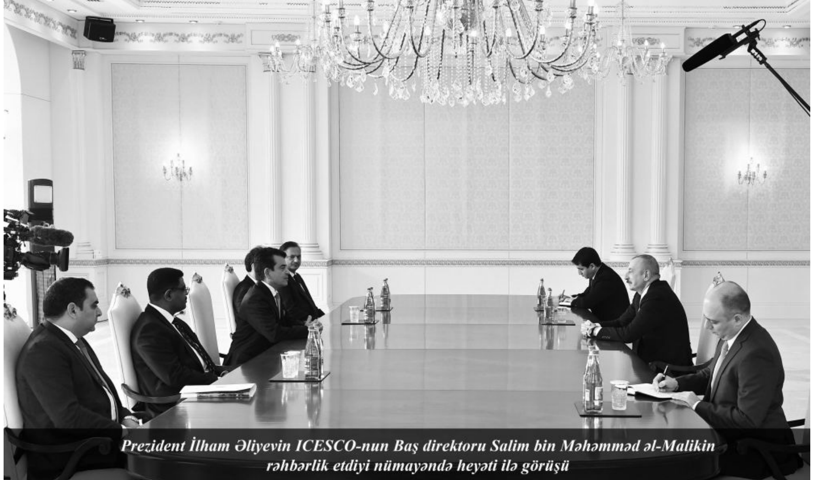
Prezident İlham Əliyevin ICESCO-nun Baş direktoru Salim bin Məhəmməd əl-Malikin rəhbərlik etdiyi nümayəndə heyəti ilə görüşü

- Xoş gəlmisiniz, Baş direktor. Hörmətli qonaqlar, xoş gəlmisiniz. Sizi görməyə çox şadam. Səfəriniz üçün, işğaldan azad edilmiş əraziləri ziyarət etmək üçün vaxt tapdığınıza görə sizə çox minnətdaram. Mənə məlumat verilmişdir ki, dünən siz müharibə zamanı Azərbaycanın işğaldan azad olunmuş şəhərlərini ziyarət etmişiniz və özünü vəziyyətin şahidi oldunuz. Hər şey tamamilə məhv edilib. Bizim bu barədə məlumatımız var idi. Çünki işğal edilmiş ərazilərdə vəziyyətlə bağlı bizdə müəyyən görüntülər var idi. Lakin səmi desəm, biz dağıntıların bu qədər geniş vüsət almasını heç təsəvvürümüzlə belə gətirə bilməzdik. Bu, onu nümayiş etdirir ki, torpaqlarımızı işğal altında saxlayan ölkə Azərbaycan mədəniyyətinin izini silmək istəyirdi. Azərbaycan xalqının irsini məhv etmək istəyirdi. Biz açıq-aydın başa düşürük ki, bu dağıntılar Birinci Qarabağ mü-