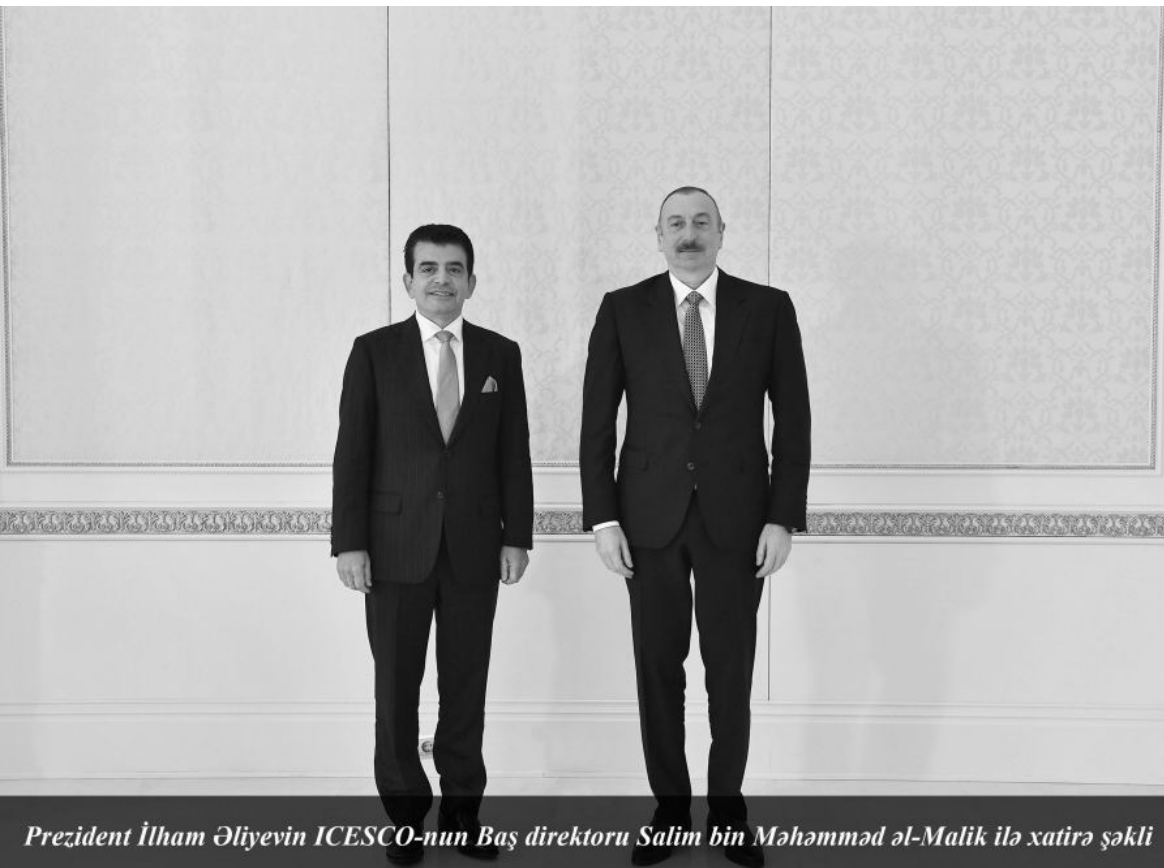
Prezident İlham Əliyevin ICESCO-nun Baş direktoru Salim bin Məhəmməd əl-Malik ilə xatirə şəkli

“Azərbaycanın tarixi torpaqlarının azad edilməsi təkcə bizim tariximizdə tarixi hadisə deyil, eyni zamanda, müharibələr tarixində əlamətdar hadisədir”