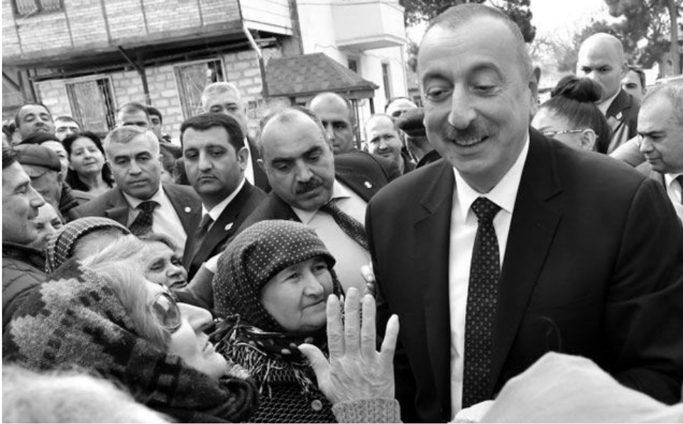
Əvvəli Səh. 4

Prezident İlham Əliyev: “Pandemiya ilə mübarizədə Azərbaycan ilk günlərdən qabaqlayıcı tədbirlər görərək, istədiyinə nail oldu”