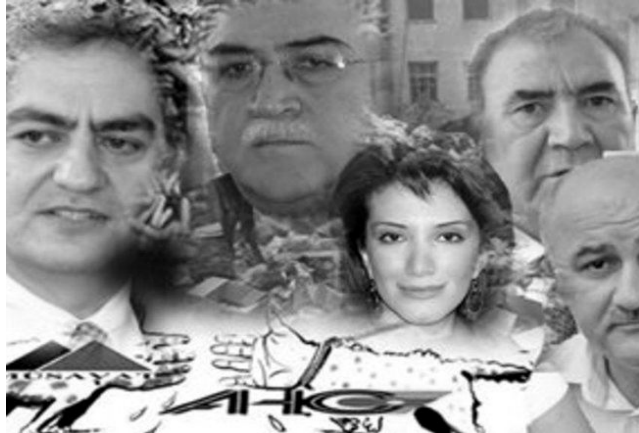
Əli Kərimlinin yalancı "həmrəyliyi"...