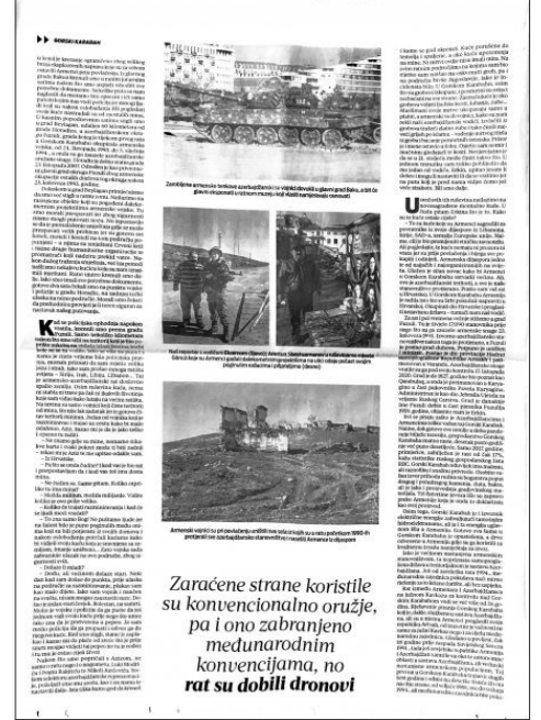
Zaraçene strane koristile su konvencionalno oružje, pa i ono zabranjeno međunarodnim konvencijama, no rat su dobili dronovi

Xorvatiyanın "Veçernji list" qəzetindən Azərbaycanda səfərdə olmuş jurnalist Hassan Haydar Diabın Qarabağla bağlı geniş məqaləsi dərc edilib. AZƏRTAC xəbər verir ki, məqalədə ikinci Qarabağ müharibəsindən bəhs olunur. Qeyd edilir ki, Birinci Qarabağ müharibəsi ilə müqayisədə bu qısamüddətli müharibədə mülki şəxslər arasında itkilər az olsa da, Ermənistan Azərbaycanın Gəncə və Bərdə şəhərlərini qadağan olunmuş silahlardan atəşə tutub, dinc əhalini hədəfə alıb. Müəllif BMT Təhlükəsizlik Şurasının münacişə ilə bağlı qətnamələrinə istinad edir, Azərbaycanın ərazi bütövlüyünün beynəlxalq hüquq tərəfindən dəstəkləndiyini vurğulayır. Jurnalist, həmçinin yeni azad olunmuş ərazilərə - Füzuli, Cəbrayıl və Qubadlı rayonlarına səfəri zamanı şahidi olduğu dağıntıların miqyasını, o cümlədən ermənilər tərəfindən məzarlıqların, yaşayış evlərinin və digər tikililərin məhv edildiyini oxucuların diqqətinə çatdırıb.