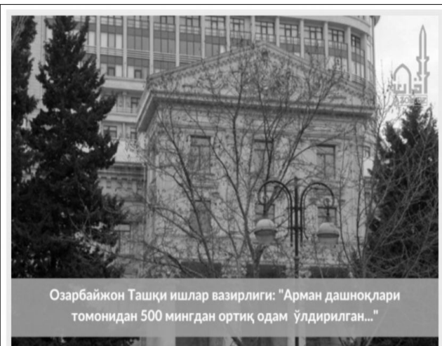
Озарбайжон Ташқи ишлар вазирлиги: "Арман дашноқлари томонидан 500 мингдан ортиқ одам ўлдирилган..."

Ozərbaycan Prezidenti İlham Əliyev Türkiyə Prezidenti Rəcəb Tayyib Ərdoğan ilə telefon orqalı suhbatlaşdı. İki mamlakat rəhbərləri AQŞ prezidenti Jo Baydenin ermən millətçiləri tomonidan targ'ib qilingan 1915-yilgi Usmonli imperiyasidagi fojiali voqealarga nisbatan ishlatilishiga munosabat bildirdi. Ozarbayjon diplomatlari Amerika rahbari tan olgan tarixiy faktlarning buziligidan afsusda ekanliklarini bildirishdi.