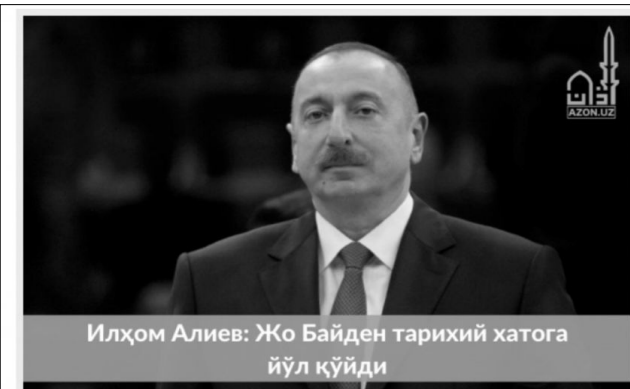
Илҳом Алиев: Жо Байден тарихий хатога йўл қўйди

Ozərbaycan Prezidenti İlham Əliyev Türkiyə Prezidenti Rəcəb Tayyib Ərdoğan ilə telefon orqalı suhbatlaşdı. İki mamlakat rəhbərləri AQŞ prezidenti Jo Baydenin ermən millətçiləri tomonidan targ'ib qilingan 1915-yilgi Usmonli imperiyasidagi fojiali voqealarga nisbatan ishlatilishiga munosabat bildirdi. Ozarbayjon diplomatlari Amerika rahbari tan olgan tarixiy faktlarning buziligidan afsusda ekanliklarini bildirishdi.