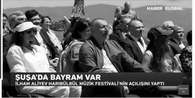
ŞUŞA'DA BAYRAM VAR İLHAM ALİYEV HARİBÜLBÜL MÜZİK FESTİVALI'NIN AÇILIŞINI YAPTI

#haber #gündem #sondakika Şuşa'da 30 Yıl Sonra İlk Kez Haribülbül Festivali! 25.952 görüntüleme • 12 May 2021