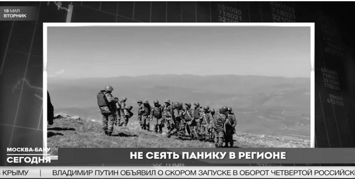
18 МАЯ ВТОРНИК МОСКВА-БАКУ СЕГОДНЯ НЕ СЕЯТЬ ПАНИКУ В РЕГИОНЕ КРЫМУ | ВЛАДИМИР ПУТИН ОБЪЯВИЛ О СКОРОМ ЗАПУСКЕ В ОБОРОТ ЧЕТВЕРТОЙ РОССИЙСКОЙ

Yazı Azərbaycan Respublikasının Medianın İnkişafı Agentliyinin maliyyə dəstəyi ilə "Ermənistan-Azərbaycan, ərazilərin işğaldan azad olunması haqqında həqiqətlərin dünya ictimaiyyətinə çatdırılması, Azərbaycanın ədalətli mövqeyinin müdafiə edilməsi" istiqaməti çərçivəsində hazırlanıb.