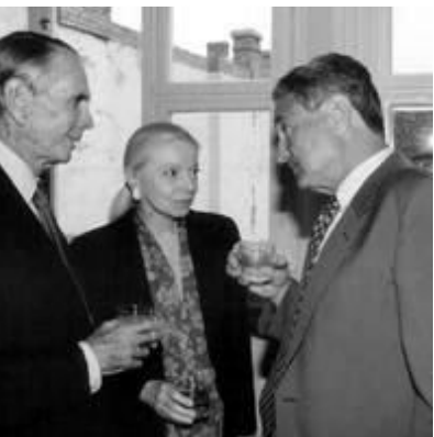
Şəkilə Antoni Blinkenin valideynləri Donald və Vera Blinken və Soros

https://www.resumenlatinoamericano.org/2020/11/26/pensamiento-critico-qui-en-es-antony-blinken-el-proximo-secretario-de-estado-de-joe-biden/