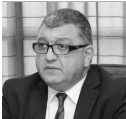
Rauf Əliyev, Milli Məclisin deputatı

Azərbaycan 1991-ci ildə müstəqilliyini bərpa etdikdən sonra dost və qardaş ölkə Türkiyə ilə bütün sahələrdə əlaqələr davamlı yüksələn xətt üzrə inkişaf edir. Azərbaycan Respublikasının müstəqilliyini ilk olaraq 1991-ci ilin noyabrın 9-da Türkiyə Cümhuriyyəti tanıyıb. Türkiyə və Azərbaycanın münasibətləri möhkəm təməllərə malikdir.