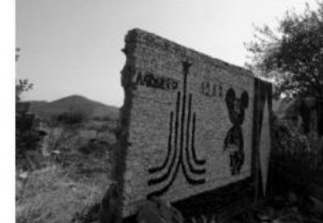
Continuamos el viaje y visitamos las ruinas de una muralla conmemorativa por el triunfo de las cuatro repúblicas soviéticas en la Segunda Guerra Mundial.

Müəllif Gəncəyə səfərindən bəhs edərək 44 günlük müharibə zamanı ermənilər tərəfindən insanlığa qarşı törədilmiş cinayətlərin şahidi olduğunu yazır. O, hərbi əməliyyatlar zamanı Ermənistan tərəfindən döyüş əməliyyatları zonasından xeyli uzaqda yerləşən şəhərin ballistik raketlərlə atəşə tutulması nəticəsində 26 mülki şəxsin, o cümlədən qadın və uşaqların həlak olduğunu və yüzlərlə