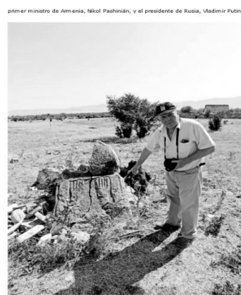
Como periodista me involucramos que nos entrevistamos con una familia de desplazados azeris de Zangazur - que se encuentran en Bakú - que con emoción nos expresaba que está dispuesta a regresar a su tierra natal pronto. Pero debido a miles de minas que tendrían que ser eliminadas y al período de reconstrucción - que empezó ya el Gobierno, con un presupuesto de 2.500.000.000 de dólares solo en el 2021 - pasarán años, por lo menos, entre cinco y diez años.