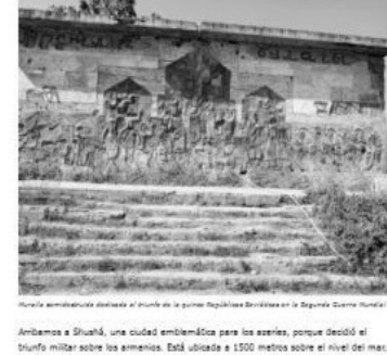
Amamos a Shushá, una ciudad emblemática para los azeris, porque decidió el triunfo militar sobre los armenios. Está ubicada a 1500 metros sobre el nivel del mar; en una montaña, en donde para llegar había un solo camino vigilado por los armenios fuertemente armados. Parecía impenetrable. Pero una noche las fuerzas de élite azeris escalaron por detrás y atacaron a los armenios armados, que lucharon cuerpo a cuerpo y fueron vencidos. No tuvieron tiempo de amasar la ciudad en su retiro.