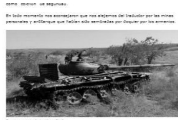
En todo momento nos acordamos que nos alojamos del trabajador por las minas presenciales y anti-tanque que habían sido sembradas por disparar por los armenios.

lanların şahidi olduğunu, xüsusilə Cəbrayıl və Ağdam şəhərlərinin erməni vandalizminə məruz qaldığını, oradakı yaşayış infrastrukturunun, tarixi və mədəniyyət abidələrinin tamamilə məhv edildiyini qeyd edir. Müəllif Cəbrayıl şəhərində olarkən hər yerdə yalnız dağılmış evlər gördüklərini və qəbiristanlıqların talan edildiyini qeyd edərək, bu mənzərələrdən dəhşətə gəldiyini vurğulayır. O, bir vaxtlar Azərbaycanın ən gözəl şəhərlərindən biri olan, hazırda isə “Qafqazın Hiroşiması” adlandırılan Ağdam şəhərində şahid olduğu erməni vandalizmindən bəhs edərək, işğal olunmuş ərazilərdə qədim məscidlərin, sarayların, tarixi memarlıq abidələrinin, mədəniyyət icmalarının və dini ibadət yerlərinin ermənilər tərəfindən dağıdılaraq yağ-