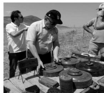
“Actualmente son tres métodos con que se realiza el proceso de desminado: la dinamita con los permisos adecuados, la limpieza de la mina con la mano y con carnos que tienen beneficios seguros. Numerosas instituciones internacionales han ofrecido apoyo para la limpieza de minas, pero solo Turquía ha concretado la ayuda”, afirmó el funcionario de Anama.

malanmaya məruz qaldığını diqqətə çatdırır.