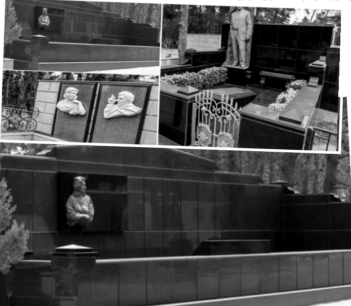
Bir ara bö-

2) Zəmanət və dayanıqlıq müddəti: Hazırladığınız məzar daşları üçün xarici faktorlara qarşı qeyd -şərtsiz zəmanət və dayanıqlıq müddətlərini aydın şəkildə öyrənin. Yağışlı və qarlı havalarda istifadə olunan materiallar keyfiyyətsiz olarsa, problemlərə səbəb olacaq. Keyfiyyətli materiallardan hazırlanan qəbir daşında montaj prose-