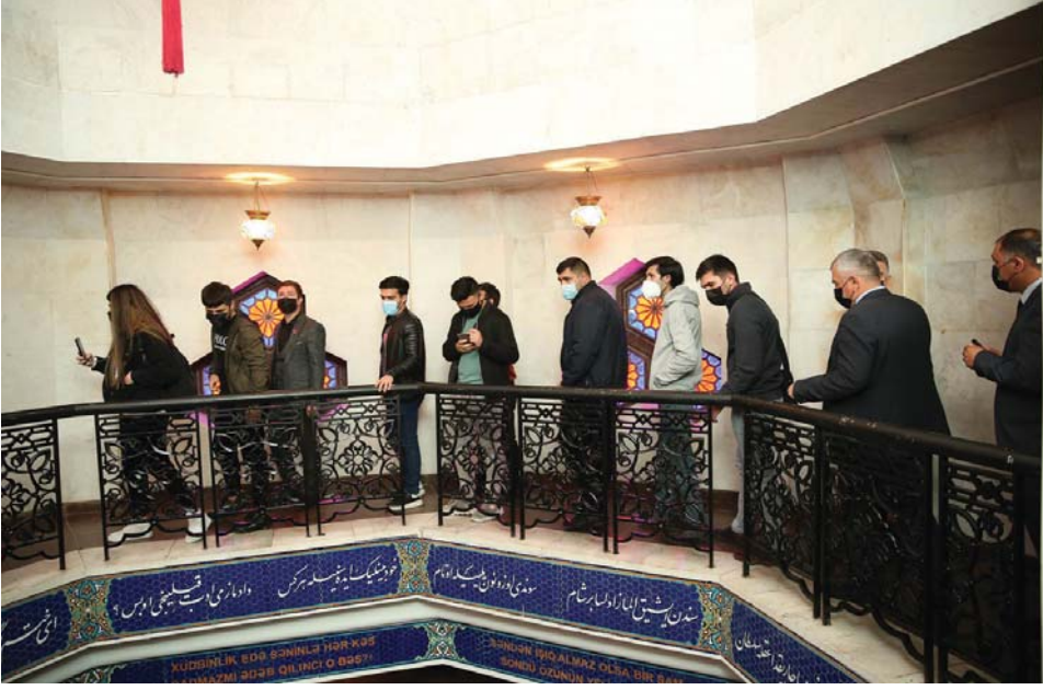
Əvvəl Səh. 8