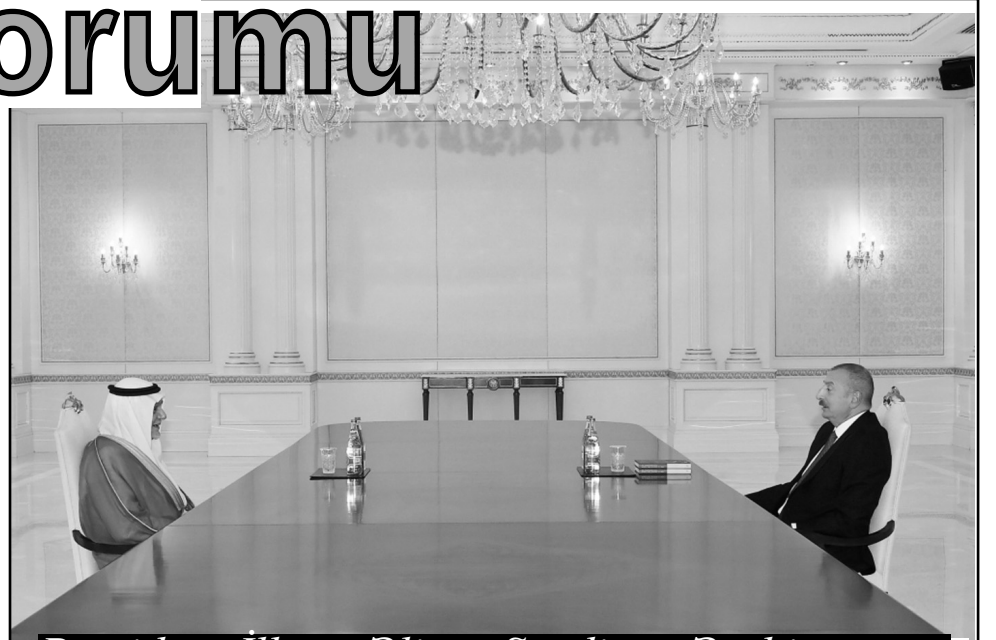
Prezident İlham Əliyev Səudiyyə Ərəbistanının Kral Faysal Araşdırma və İslami Tədqiqatlar Mərkəzinin İdarə Şurasının sədrini qəbul edib

Görüşdə Səudiyyə Ərəbistanının Kral Faysal Araşdırma və İslami Tədqiqatlar Mərkəzinin ölkəmizin müvafiq qurumları ilə səmərəli əməkdaşlığından məmnunluq ifadə olundu.