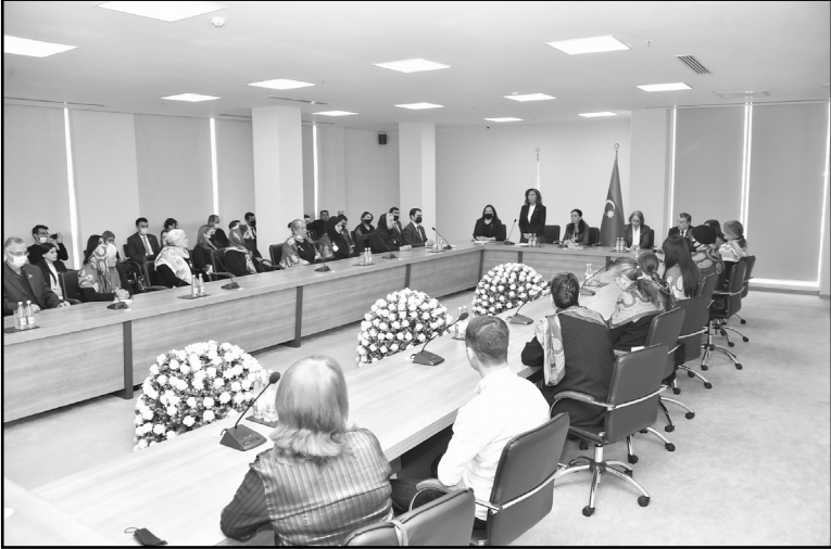
Noyabrın 3-də Yeni Azərbaycan Partiyasının Mərkəzi Aparatında "Zəfər və qəhrəmanlıq simvolu: məğrur Azərbaycan qadını" mövzusunda dəyirmi masa keçirilib.

YAP Mərkəzi Aparatında bu mövzuda dəyirmi masa keçirilib