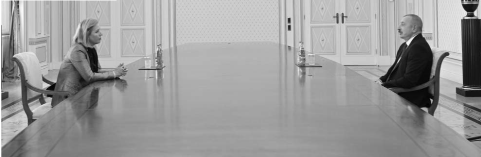
Prezident İlham Əliyev İsrailin sabiq xarici işlər nazirini qəbul edib

Azərbaycan Respublikasının Prezidenti İlham Əliyev noyabrın 4-də İsrailin sabiq xarici işlər naziri Tzipi Livnini qəbul edib. AZƏRTAC xəbər verir ki, görüşdə “COVID-19-dan sonrakı dünya” mövzusunda növbəti