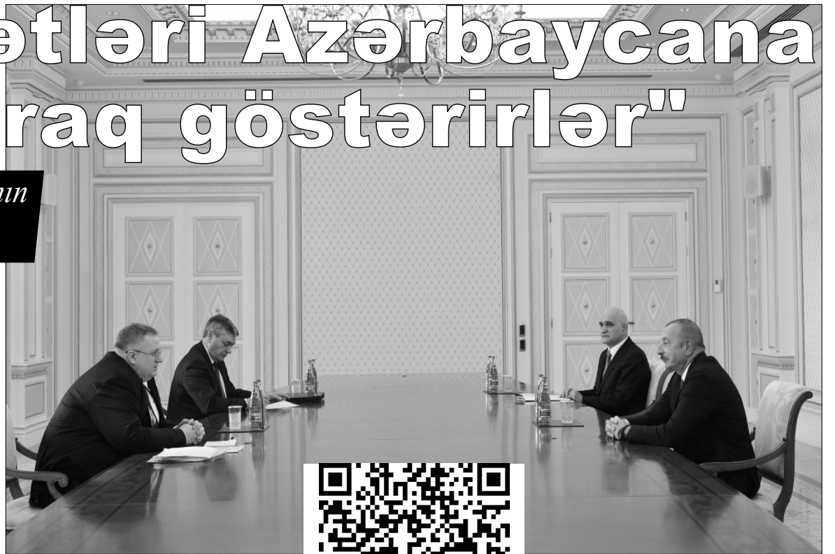
Aleksey Overçuka təşəkkürünü bildirdi.

Söhbət zamanı Rusiya-Azərbaycan-Ermənistan Baş nazirlərinin müavinlərinin sədrliyi ilə üçtərəfli komissiyanın fəaliyyəti və eləcə də gələcək planlar haqqında fikir mübadiləsi aparıldı. Dövlətimizin başçısı İlham Əliyev bu sahədə göstərdiyi səylərə görə