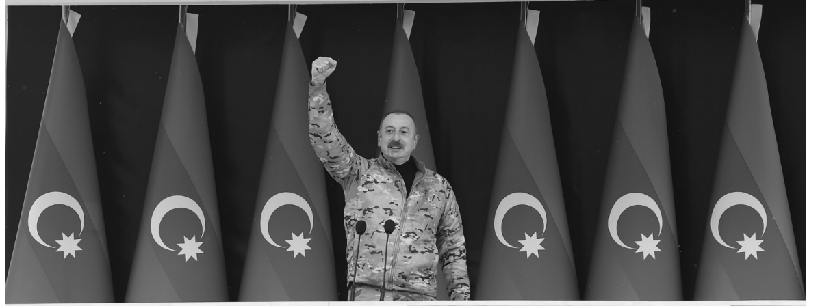
Prezident, Müzəffər Ali Baş Komandan İlham Əliyev Hadrut qəsəbəsində hərbi hissənin açılışında iştirak edib

Hadrut əməliyyatı İkinci Qarabağ müharibəsində xüsusi əhəmiyyətə malik olan bir əməliyyat idi. İlk növbədə ona görə ki, bu