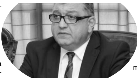
Rauf Əliyev Milli Məclisin deputatı

Rusiyada həm qiymətlər, həm də ixrac rüsumları artmışdır və artmaqda davam edir. Çörəyin qiyməti süni sürərdə əvvəlki səviyyədə saxlanıla bilməzdi. Bu nəzərə alındı və eyni zamanda, dövlətin tənzimləyici rolu gücləndirildi ki, süni qiymət artımı olmasın. Eyni zamanda ölkədə çox geniş sosial paket həyata keçirildi. Minimum əmək haqqı 20 faiz, minimum pen-