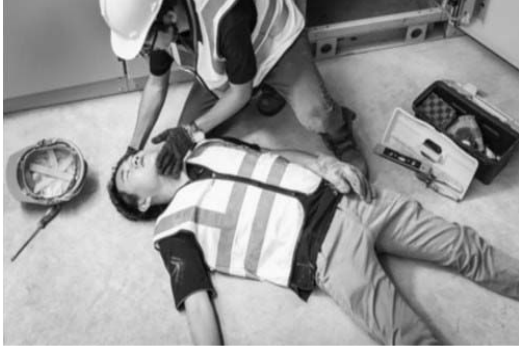
Əvvəli Səh. 11

Bəs, iş yerlərində baş verən faciəvi ölümlərdə günahkar kimlərdir? İş yerində insanlar təhlükəsizlik qaydalarına necə riayət etməlidirlər? Əmə-