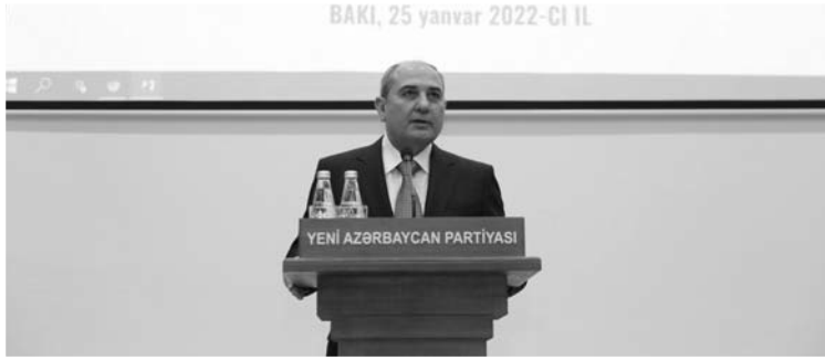
BAKI, 25 yanvar 2022-CI İL

"30 il ərzində erməni vandalları tərəfindən darmadağın edilən əraziləri, daşınmaz əmlakı, maddi və mənəvi sərvətləri qısa müddətdə bərpa etmək o qədər də asan olmayacaqdır. Amma onu da əminliklə söyləmək olar ki, xalqımız üçün 30 illik həsrətə son qoyan, öz cəsarəti, uzaqqörən si-