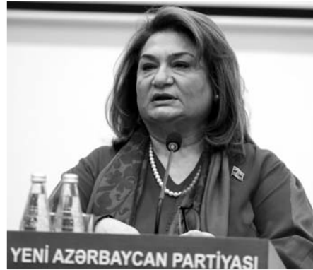
YENİ AZƏRBAYCAN PARTİYASI

vəziyyətdən maksimum istifadə etmək lazımdır. Ancaq, eyni zamanda, qarşıya çıxan çətinlikləri də müəyyən etmək və onların aradan qaldırılması istiqamətində işləri daha da gücləndirməliyik. Bu gün sahibkar qadınlarımız şəhid ailələrinə, qazilərə və onların ailələrinə, əlil qadınlara və digər həssas qrupdan olan qadınlara dəstək olurlar". Ailə, Qadın və Uşaq Problemləri üzrə Dövlət Komitəsinin sədri, YAP İdarə Heyətinin üzvü Bahar Muradova çıxışında bildirib ki, 44