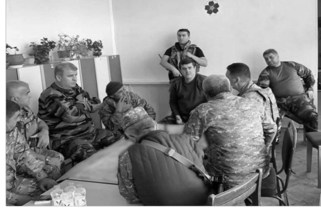
oyunbazlıqlarını davam etdirirlər!