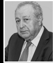
Ayaz Niyazi oğlu Mütəllibov

Xatırladaq ki, Nazirlər Kabineti yanında Operativ Qərargahın ölkədə epidemioloji vəziyyətin yaxşılaşması ilə əlaqədar xüsusi karantin rejiminin yumşaldılması barədə qəbul etdiyi qərara əsasən dövlət orqanlarında vətəndaşların qrup halında və fərdi qaydada qəbul edilməsinə artıq icazə verilib. Hazırda mərkəzi və yerli icra hakimiyyəti orqanlarının rəhbərləri tərəfindən vətəndaşların səyar qəbulları həyata keçirilməkdədir. Eyni zamanda, Prezident Administrasiyasının struktur bölmələrinin rəhbərləri tərəfindən də vətəndaşlar qəbul ediləcəklər.