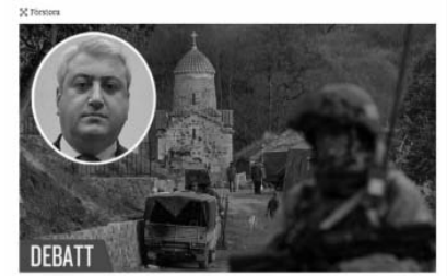
En av de förstörda gasledningarna i Karabach som påstås vara förstörda av Azerbajdžjan. Bilden är ett foto som tagits av en lokal beboare i Karabach. Zaur Ahmadov, Azerbajdžjans ambassadör till Sverige. 14 April 2022 06:00

Replik. Angående de ogrundade påståendena om förstörda gasledning är det uppenbart att Armenien utnyttjar de tekniska problem som uppstått till följt av ogynnsamma väderförhållanden i området som ett verktyg för politisk manipulation, skriver Zaur Ahmadov, Azerbajdžjans ambassadör till Sverige.