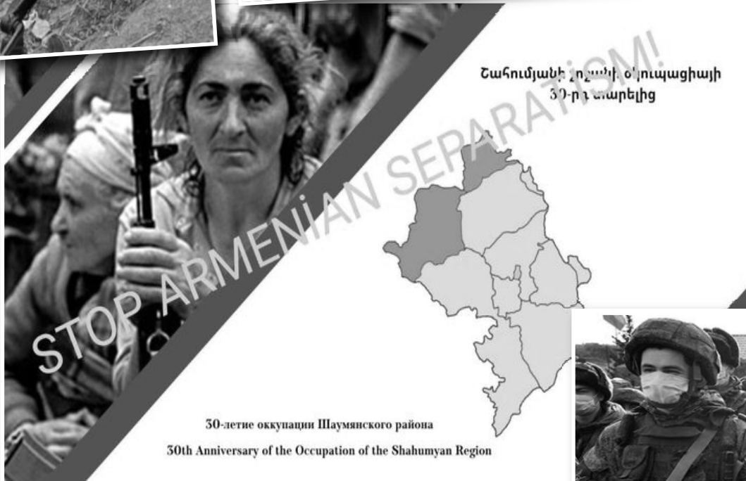
50-летие оккупации Шаумянского района 50th Anniversary of the Occupation of the Shumyan Region