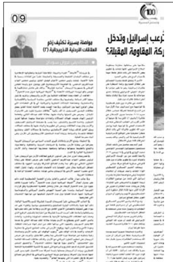
İordaniyanın “Əl Ənbat”, “Cohina”, “Şaab” qəzetlərində, həmçinin Əlcəzairin “Əl Hərir” portalında Qoşulmama Hərəkatının Bakı konfransı və İordaniya-