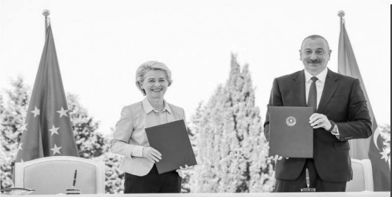
ЕС подписал с Азербайджаном меморандум о стратегическом сотрудничестве в энергетике

G ürcüstanın aparıcı informasiya portalları Azərbaycan Prezidenti İlham Əliyev ilə Avropa Komissiyasının Prezidenti xanım Ursula Fon der Lyayen arasında keçirilən görüş, eləcə də Azərbaycan ilə Avropa İttifaqı (Aİ) arasında "Azərbaycan Respublikası ilə Avropa Komissiyası tərəfindən təmsil olunan Avropa İttifaqı arasında enerji sahəsində Strateji Tərəfdaşlığa dair Anlaşma Memorandumu" barədə silsilə materiallar dərc ediblər.