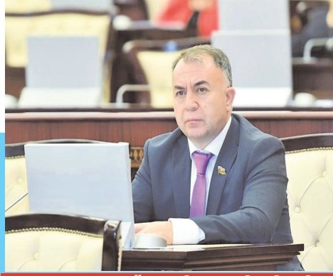
DEPUTAT MÜNASİBƏT BİLDİRDİ

liqlı sərhədlərin tanınması prosesi baş verməyib. Azərbaycan öz mövqelərini yuxarı çəkərək zirvələri nəzarətə götürüb. Paşinyan üçün erməni xalqının əsgərləri o qədər də maraqlı deyil, yəni ona erməni əsgərlərinin toyuq kimi qırılmasının fərqi yoxdur. Axı bilirsiniz ki, noyabra qədər sülh sazişinin ilkin variantı hazırlanmalıdır. Ermənilər bu prosesi ləngitməyə və vaxt qazanmağa hesablanmış təxribatlardır. Əgər ona imza atarsa, daxildə devrilmək məsələsi Paşinyan