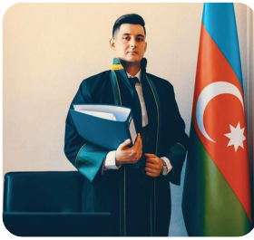
VƏKİL ƏHATƏLİ İZAH ETDİ

S on zamanlar ailədaxili münacişələr kəskin şəkildə artıb. Biz hətta qadının kişini öldürdüyünün belə şahidi olmuşuq. Ümumiyyətlə, bu cür hallar qanunla necə tənzimlənir? Ailədə şiddət görün qadın və ya kişi qanuna uyğun olaraq hansı quruma müraciət etməli və hansı tədbirləri görməlidir?